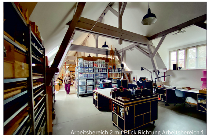
Arbeitsbereich 2 mit Blick Richtung Arbeitsbereich 1