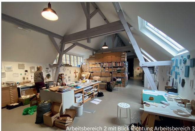
Arbeitsbereich 2 mit Blick Richtung Arbeitsbereich 3